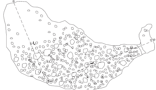
PLANTA DE FONDO