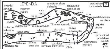
Escala en Metros