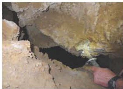
En la parte inferior, mirando en otro sotano