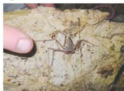
Amblypigi - order of Arachnids