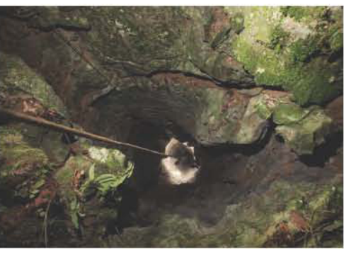
Rob Spangler