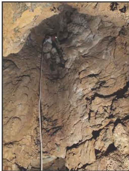
Rob en cuerda