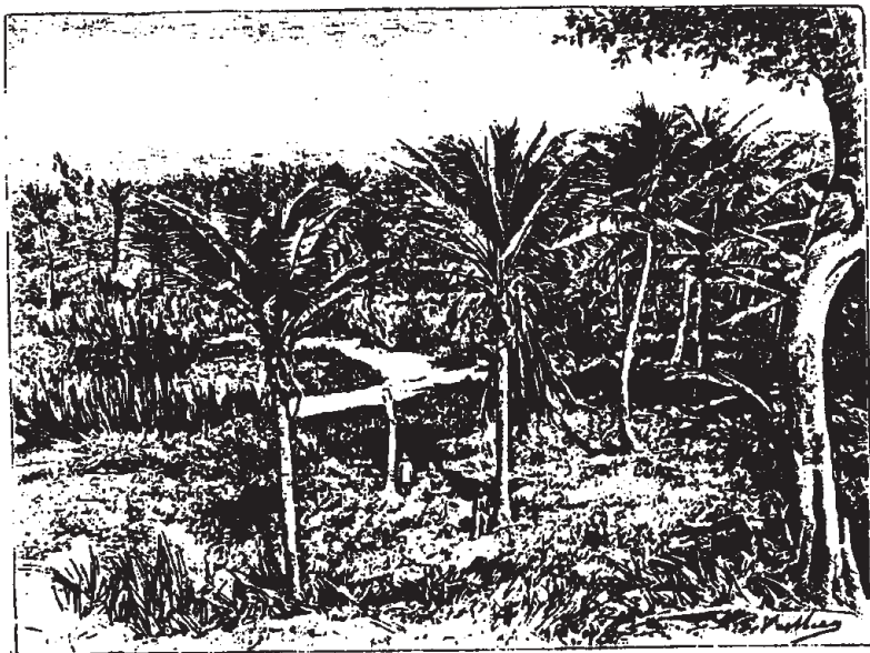
Réservoir de l'ancienne ville de Tecoch. - Dessin de G. Vuillier, d'après une photographie.