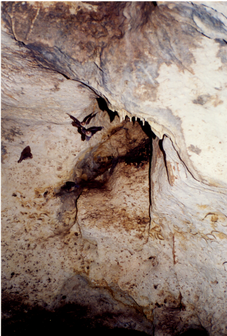
Murciélagos Natalus stramineus (Natalidae) en la Gruta del Rancho de Sambulá, Yucatán