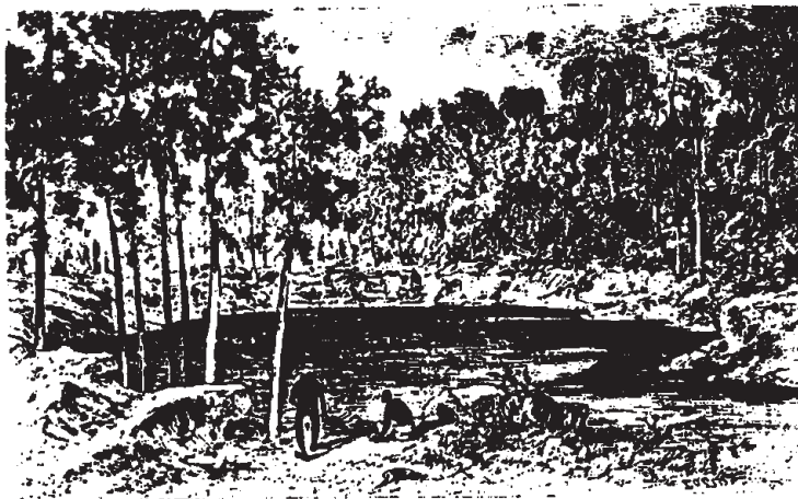
Cénoté de Xcolac. -Dessin, d'après un croquis de l'auteur