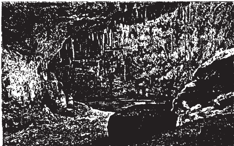
Cénote de Valladolid (voy. p. 293). - Dessin de G. Vuillier, d'après une photographie.