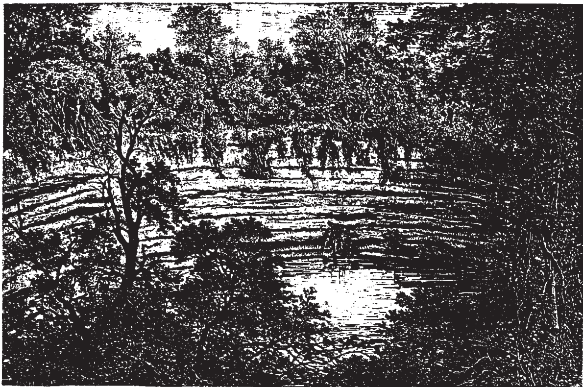
Cénôté sacré (voy. p. 42 et 43): - Dessin de A. de Bar, d'après une photographie.